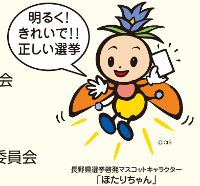
長野県選挙啓発マスコットキャラクター 「ほたりちゃん」