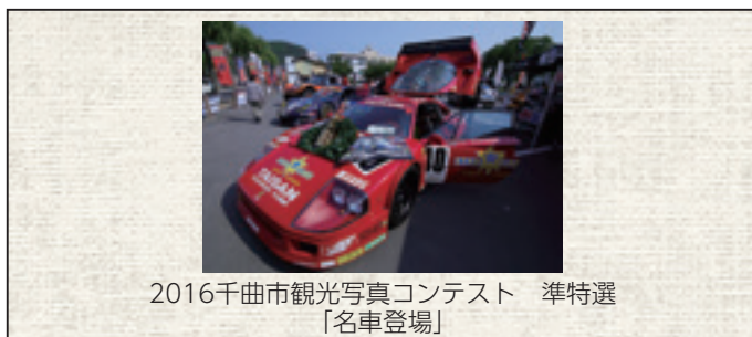
2016千曲市観光写真コンテスト 準特選 「名車登場」