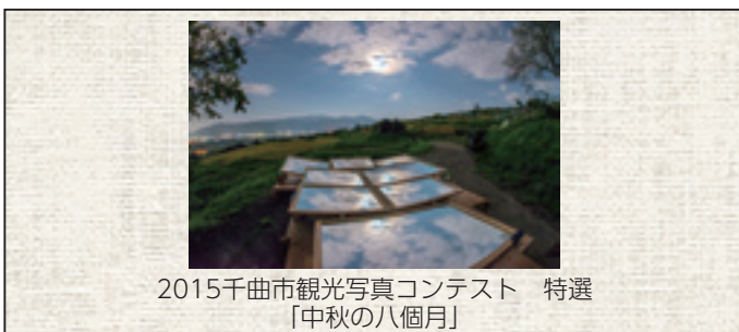
2015千曲市観光写真コンテスト 特選 「中秋の八ヶ月」