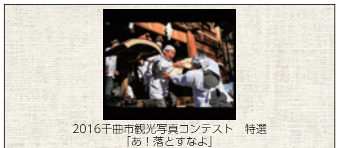
2016千曲市観光写真コンテスト 特選 「あ！落とすなよ」