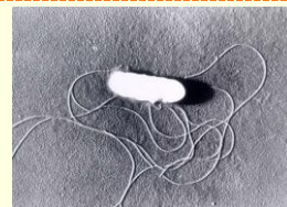
リステリアの顕微鏡写真（約0.5×1μm）

リステリア（リステリア・モノサイトゲネス）は、動物の腸管内や環境中に広く分布している細菌で、食品を介して感染する食中毒菌です。多くの食中毒菌が増殖できないような低温や高い塩分濃度の食品でも増殖します。