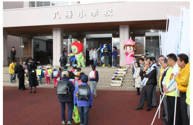
▲H28. 4/11 信州あいさつ運動（八幡小学校）

市少年育成センターでは 30 名の市民が補導委員を務め、駅や子どもたちが立ち寄りそうな場所を定期的に巡回し、ひと声かけ、注意、助言、指導の活動により、少年非行の未然防止につながっています。