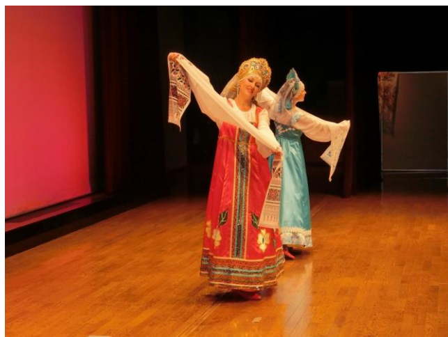
▲H28. 11/13 開催 千曲万博 2016 (戸倉創造館)