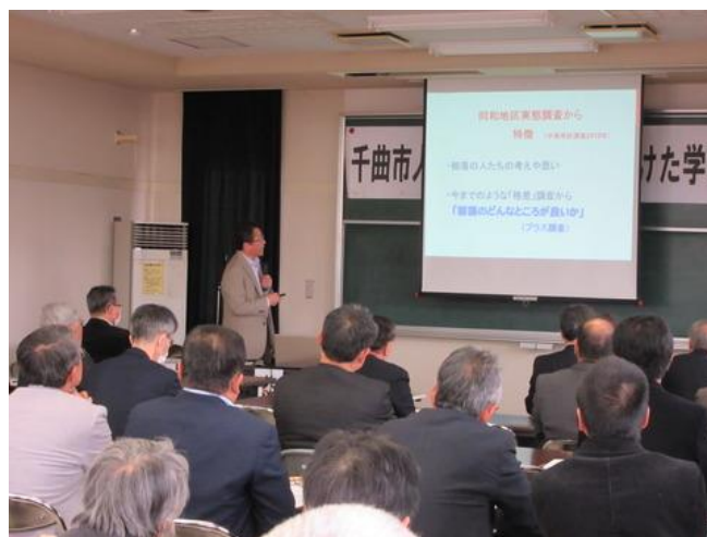
▲H29.3/5 千曲市人権のまちづくりに向けた学習会（人権ふれあいセンター）