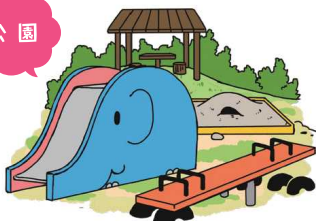
所有者不明土地も併せて利用して公園を整備しよう！