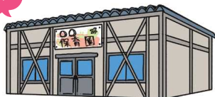
園舎の建替のために一時的に使える土地を確保しよう！