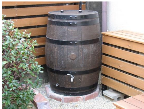
▲雨水貯留タンク (イメージ)

建物等の屋根の雨水を貯留させるための構造を持った施設で、雨どいに接続し、架台等により固定されているもの及び地下タンク方式のものをいいます。