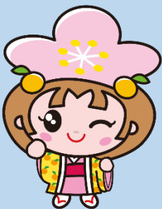
千曲市キャラクター あん姫