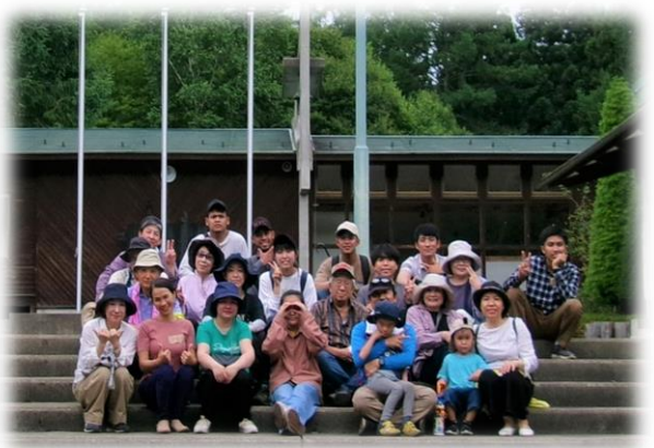
【日本語教室交流会(記念写真) R5.7.9】