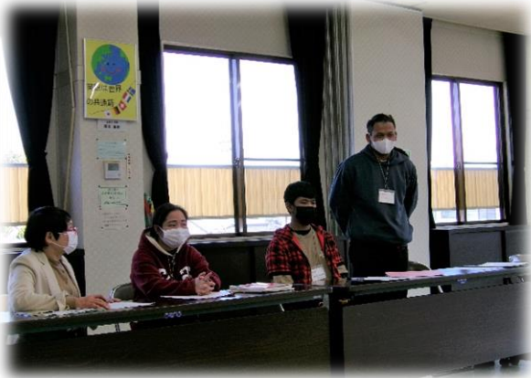
【日本語教室開校式 R5.4.9】

これまで、様々な国の皆さんが日本の生活に馴染めるように、交流会を行ってきました。今年度は、「千曲市原体験の森宿泊研修施設 大池自然の家」でバーベキューを通して親交を深めました。