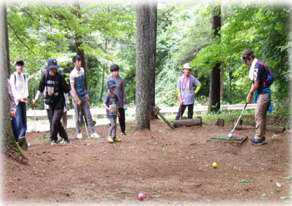
【日本語教室交流会(マレットゴルフ) R5.7.9】