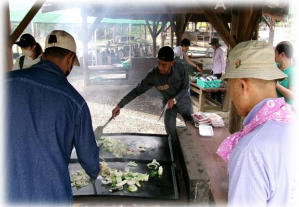
【日本語教室交流会(バーベキュー) R5.7.9】