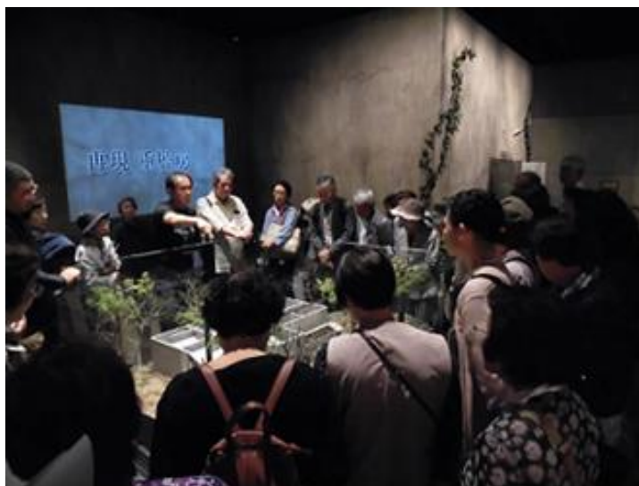
▶ R1.9/20 ふれあいセミナー (国立ハンセン病療養所 栗生楽泉園)