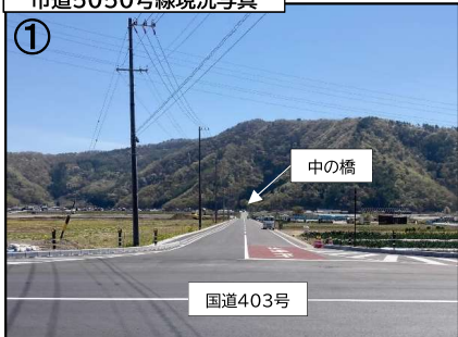
市道5050号線現況写真

令和3年1月より進めておりました市道5050号線(団地南側の道路)の拡幅工事がこのたび完了し、通行ができるようになりました。施工中は地域の皆様にご不便をおかけしましたが、ご理解ご協力を賜り無事完成させることができました。厚く感謝申し上げます。