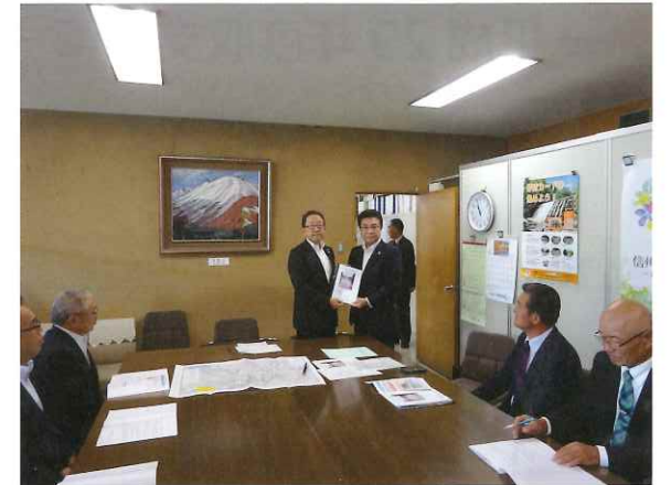
長野県への陳情 (油井建設部長へ要望書を手渡し)