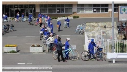
<学校での交通安全教育>

◇本市では、悲惨な自転車での事故をゼロにすることを旨として、自転車ルールやマナーを知り、理解する機会を創出するなど、関係機関と連携し、自転車利用者の年齢層やライフステージに応じた効果的な交通安全教育を実施します。