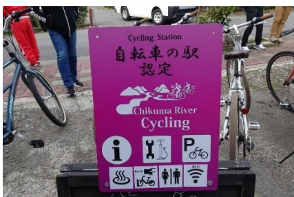
<「自転車の駅」認定看板>