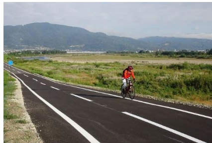
<千曲川サイクリングロード>