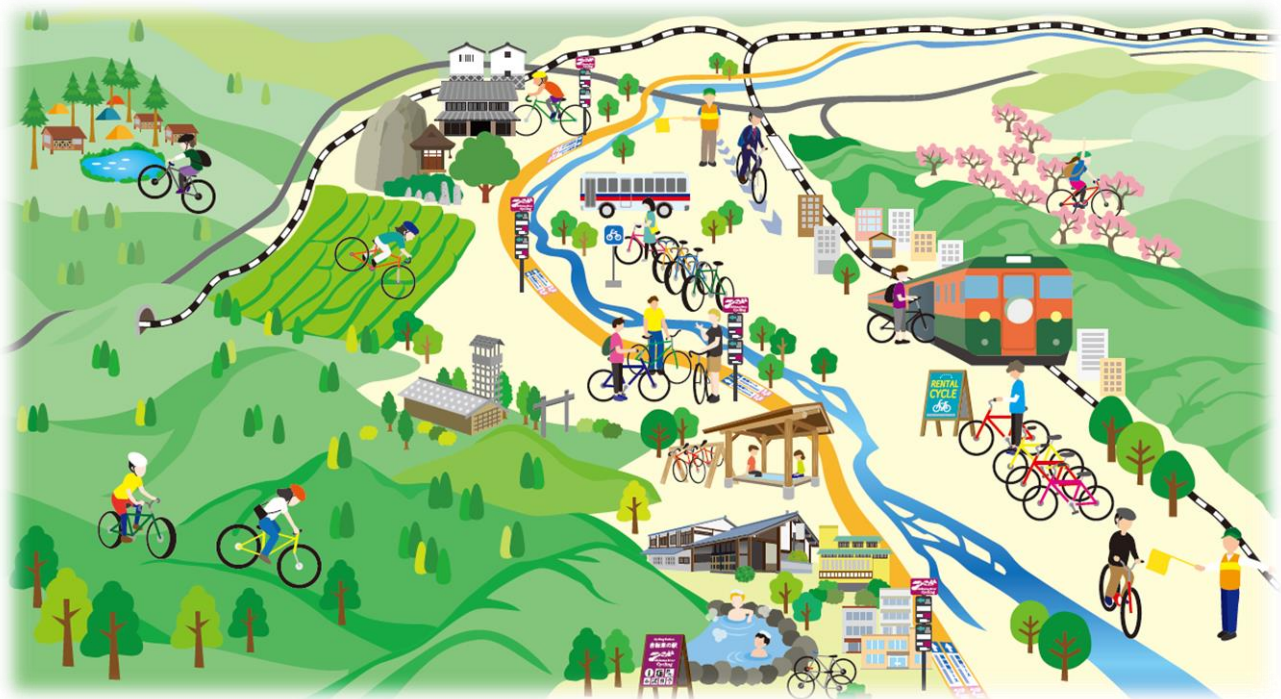
<本計画の目指すべき将来像のイメージ>