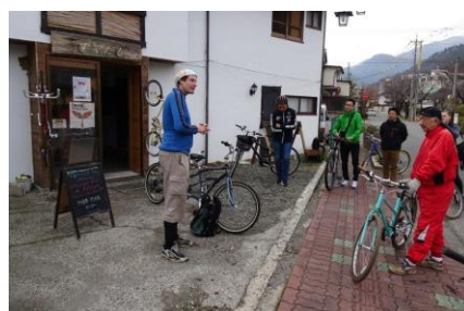
<サイクリングイベント>