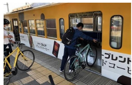
<サイクルトレインの事例>