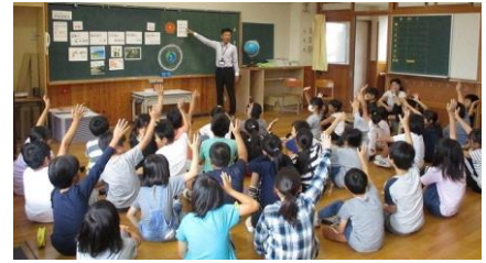
<小学校での環境学習>

◇本市では、自転車通勤の促進によるクルマ利用から自転車利用への転換、自転車に乗ること自体を楽しむサイクリングの普及など推進することで、健康的で環境にやさしいライフスタイルへの転換を促進します。