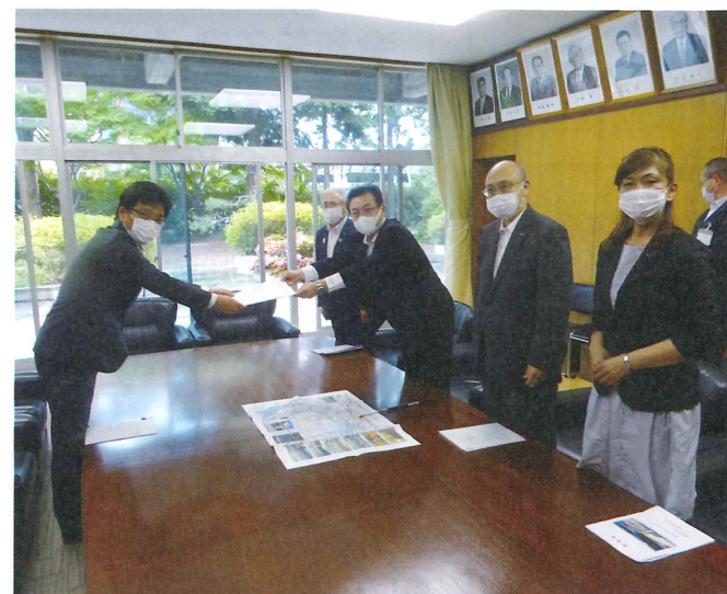
長野県議会へ請願書の提出

令和2年6月22日、長野県議会議長へ沢山川の治水対策を求める請願書を提出しました。提出した請願書は7月3日の長野県議会本会議にて全会一致で採択されました。