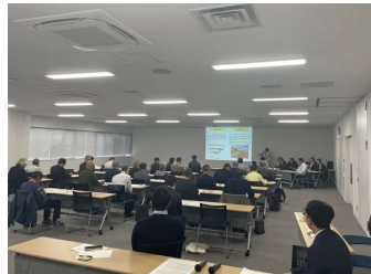
←11/12 開催事業説明会 (市役所内会議室にて)