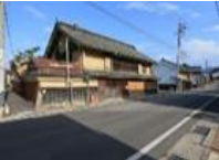
稲荷山伝統的建造物