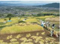
姨捨の棚田での耕作