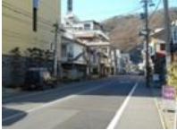
戸倉上山田温泉街