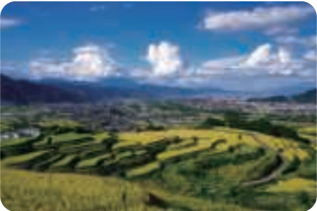
姨捨の棚田からの眺望