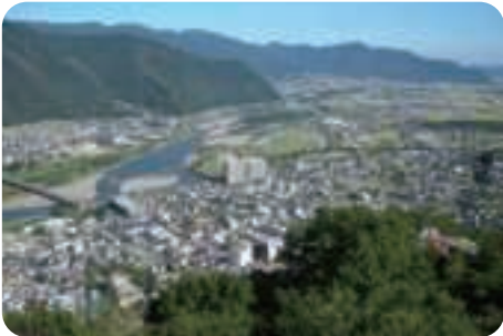
荒砥城からの眺望