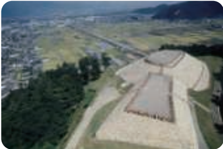
森將軍塚からの眺望