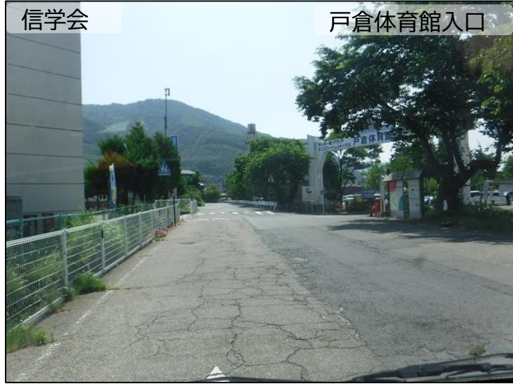
② 戸倉体育館入口 付近