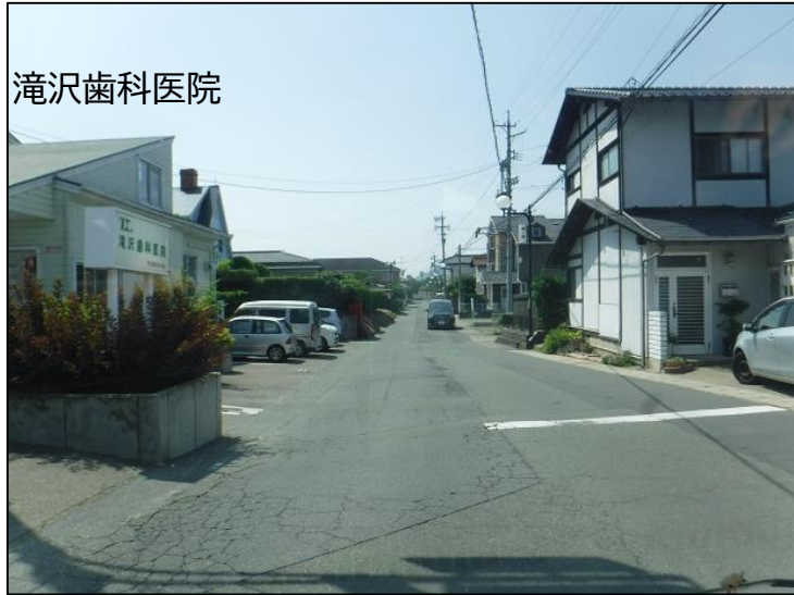
① 総合体育館入口 交差点