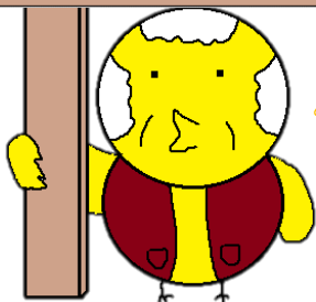
電話でお金詐欺防止キャラクター ピィいさん