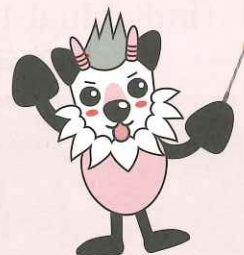
長野県消費者被害防止啓発キャラクター モシカッチ