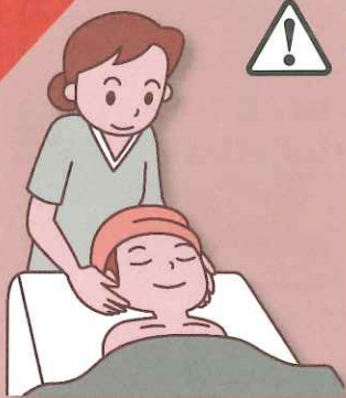
(消費者庁イラスト集より)