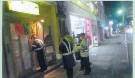
「年末の交通安全運動」で、飲食店を対象とした「飲酒運転防止パトロール」を実施した。(飯伊)