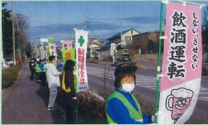
「年末の交通安全運動」で、御代田町内の県道において飲酒運転防止などを呼び掛けた。(佐久)