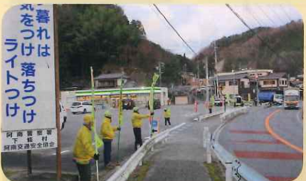
「年末の交通安全運動」で、管内の国道において街頭啓発活動を実施した。(阿南)