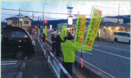
「年末の交通安全運動」で、市役所西県道交差点において街頭啓発活動を実施した。(茅野)