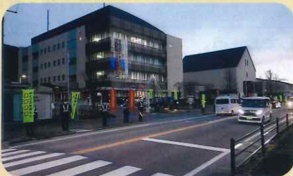
「年末の交通安全運動」で、諏訪警察署前において街頭啓発活動を実施した。(諏訪)