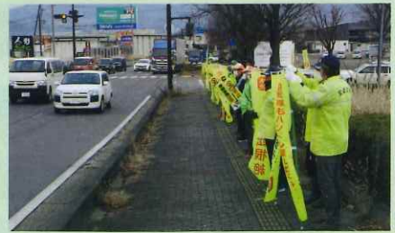
「年末の交通安全運動」の活動で、松代大橋前県道において街頭啓発活動を実施した。(長野南・松代)