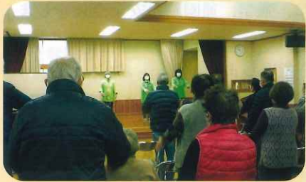
管内の公民館において高齢者に対する交通安全教室を開催した。(小諸)