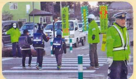
「年末の交通安全運動」で、通学路において児童に対する見守り活動を実施した。(池田松川)