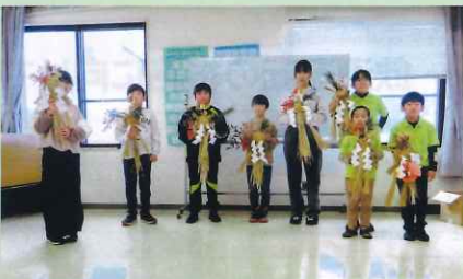
「年末の交通安全運動」で、少年部による交通安全を祈願した「正月飾り作成研修会」を開催した。(安曇野)