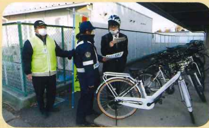
「年末の交通安全運動」の活動で、管内の高校において自転車ヘルメットの着用啓発を実施した。(須高)