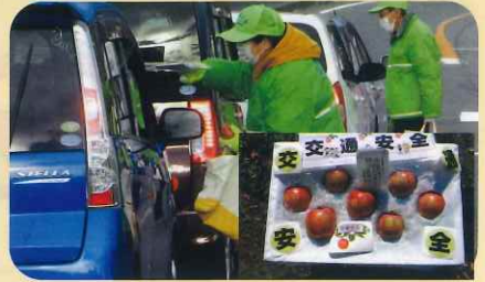
「年末の交通安全運動」で、ドライバーに「交通安全文字入りりんご」を手渡して交通事故防止を指導した。(川西)