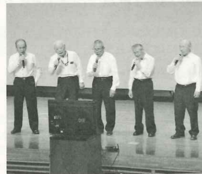
カラオケ発表で熱唱中(内川分館)