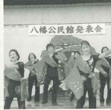
華やかなダンスです