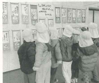
見て！小学校でがんばりたいこと、書いたよ！