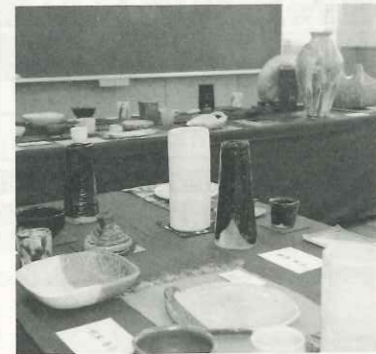
色とりどりの陶芸作品です