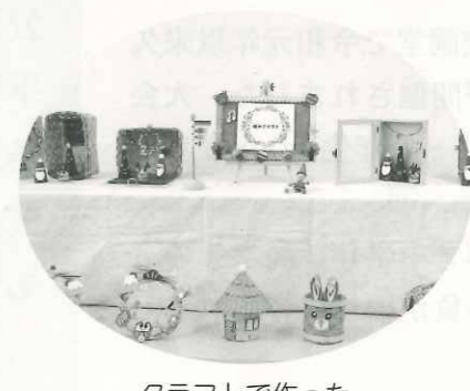
クラフトで作ったかわいい小物が並びます