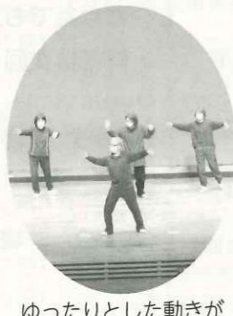
ゆったりとした動きが特徴の楊式太極拳