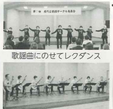
歌謡曲にのせてレクダンス ギター音色に癒されて