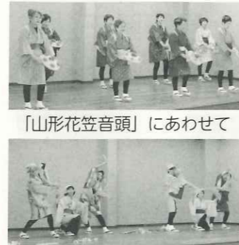
「山形花笠音頭」にあわせて 金の鮪 名古屋城