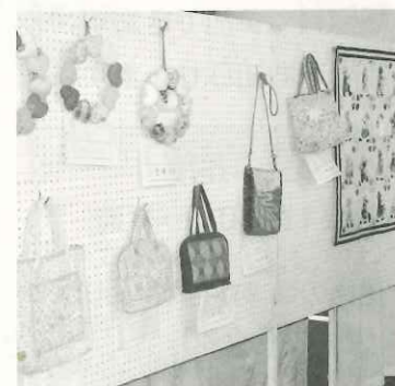
見事なパッチワーク作品です