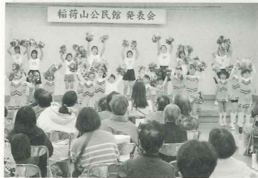
会場いっぱい笑顔が広がります