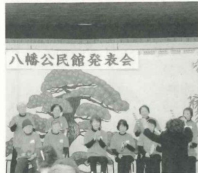
「郡ささやき会」の楽器演奏です