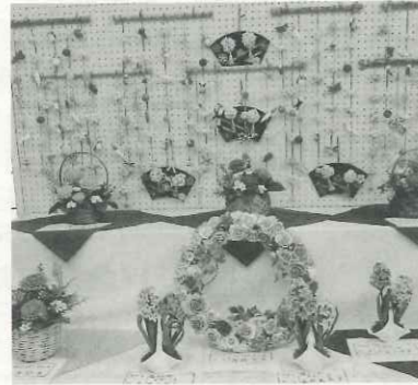
春らしい粘土のお花が並びます