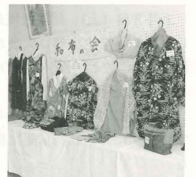
和服が洋服や小物によみがえりました