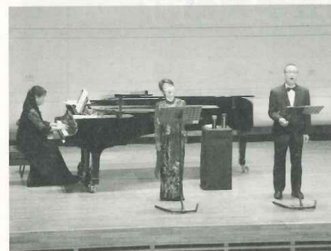
トリオ「shin」による素晴らしい演奏です