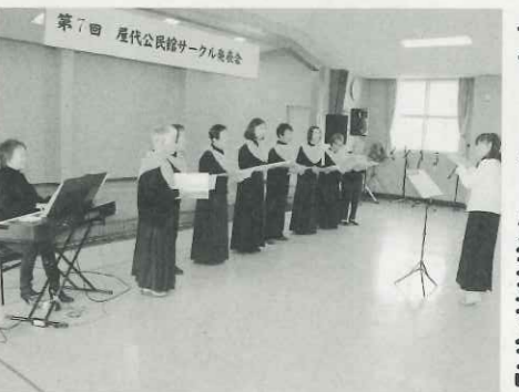
美しいハーモニーに酔いしれて