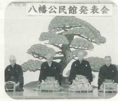
日頃の成果を披露します