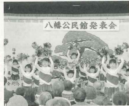
元気なチアダンスで心が和みます