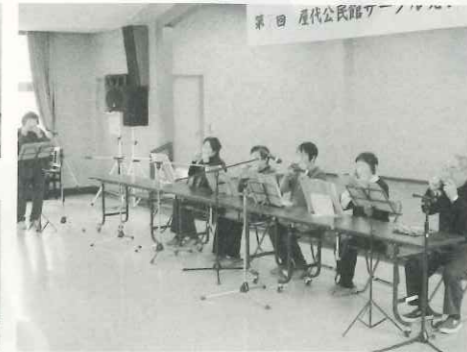
ハーモニカにあわせ観客も歌いました