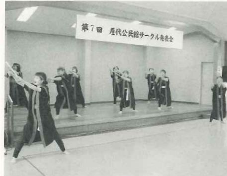
「多喜雄のソーラン」に元気をもらいました