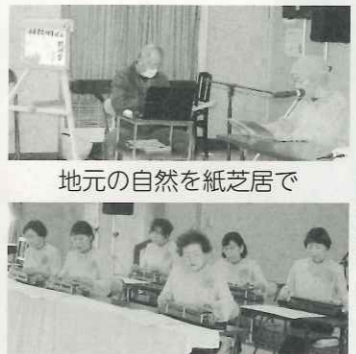
息の合った大正琴の演奏