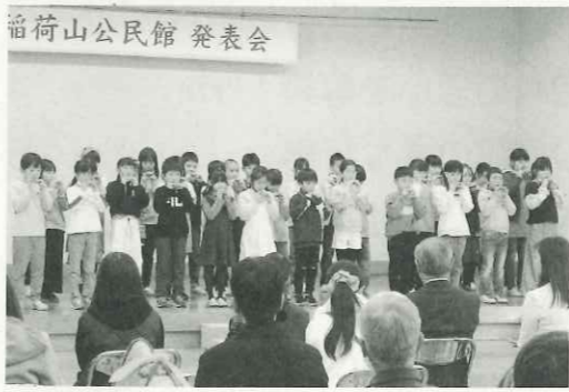
治田小学校3年生の楽しいコカリナ演奏です