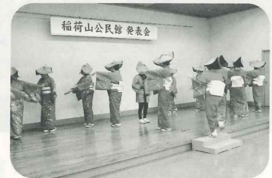
「信州さらしな月の里唄」の歌にのせて