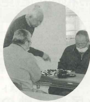
アドバイスにも熱が入ります