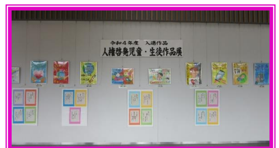
児童・生徒作品展