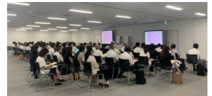
<R5 第3回ふれあいセミナー>