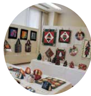
パッチワークの 素敵な作品に見とれます