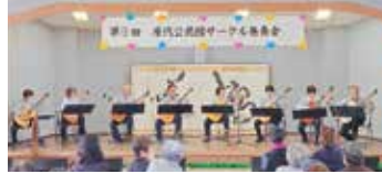
ギターのかっこいいフレーズに聴き惚れます