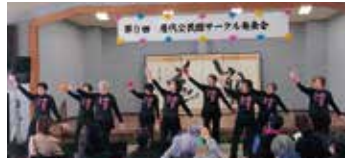
はじける笑顔と優雅なステップ