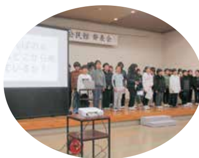
治田小学校の5年生が発表しています