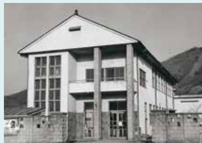
写真② 2代目の埴生公民館 (旧埴生町役場)

昭和22年 寂蒔・鋳物師屋 昭和23年 打沢・小島・桜堂 昭和30年 杭瀬下・新田・中が加わり8分館体制となる。