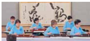
息の合った大正琴アンサンブルが響きます