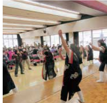
みんなで一緒に踊りましょう!!