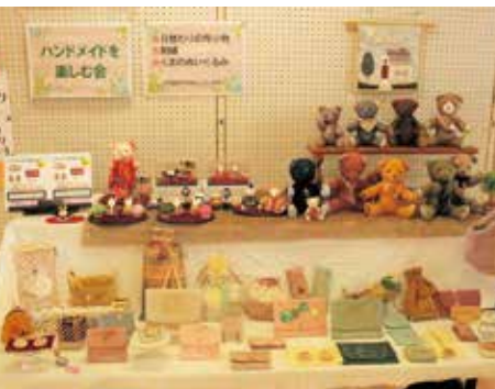
かわいいぬいぐるみの作品が並んでいます