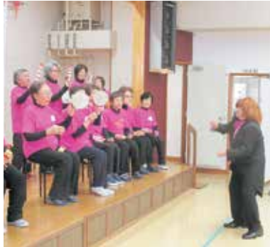
ベートーベンが来ました