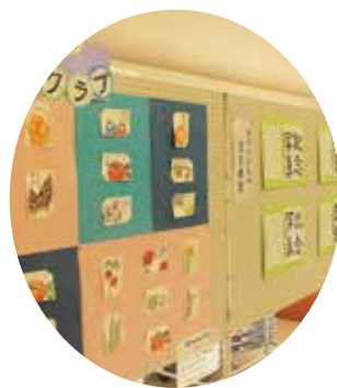
絵や習字など作品がずらり