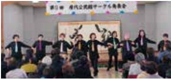
今日はネクタイで！レクダンス