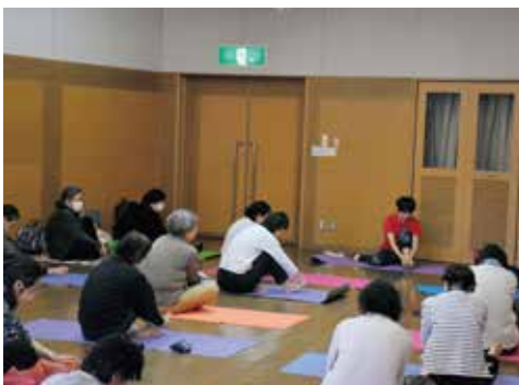
「リンパケア」の体験発表