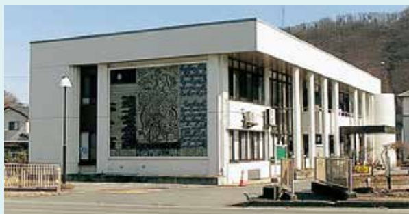
写真③ 現在の埴生公民館