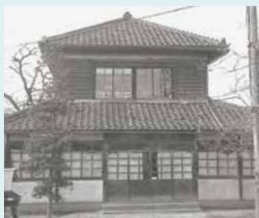
写真① 初代の埴生公民館

発行/千曲市公民館運営協議会 編集/千曲市公民館報編集委員会 電話026-1276-15842 FAX026-1276-7330