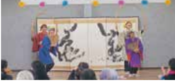
玉すだれ「かぐや姫」のシーンです