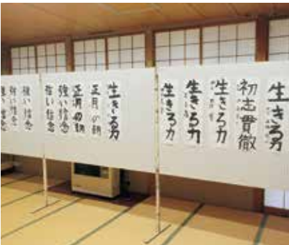
小学生の書初めが並んでいます