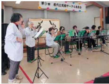
かつぼう着で懐かしいハーモニカを吹きます