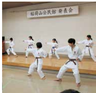
空手の演武に気合が入ります