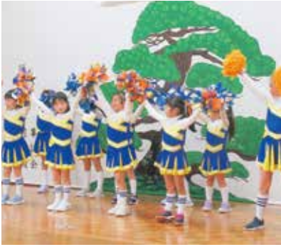
子どもたちのダンスに元気もらいました