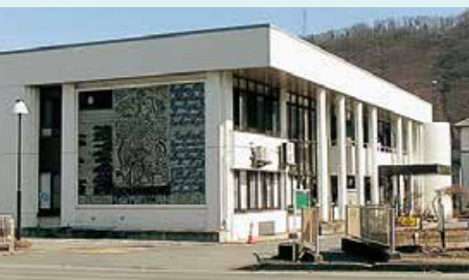
写真③ 現在の埴生公民館

から現在までの78年間、館長は私で26代目になります。歴代の館長さん、分館長さんならびに公民館関係者の皆さんが「つとめ」「まなび」「むすぶ」のテーマを念頭に、地域の皆さんの教養と文化、健康増進のための公民館の弛みない努力のあしあとが、古い公民館資料から垣間見ることができました。