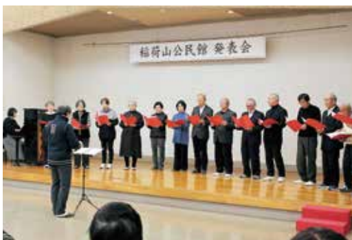
成人講座受講生の皆さんによるコーラス