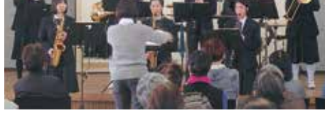
屋代中吹奏楽部の迫力ある演奏