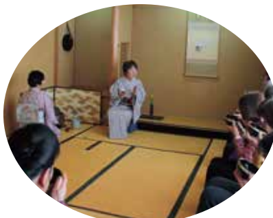
大盛況のお茶のお振舞い 「茶道教室」