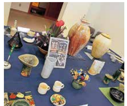
「新しい陶芸教室」の力作ぞろい