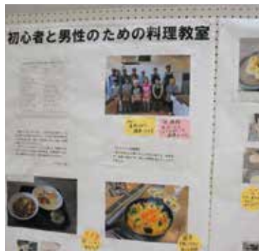
楽しい様子が伝わってきます