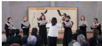
心は青春！屋代コーラスのみなさん