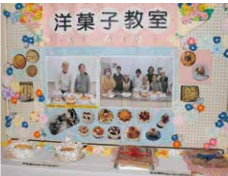
みんなで和気あいあいと作りました