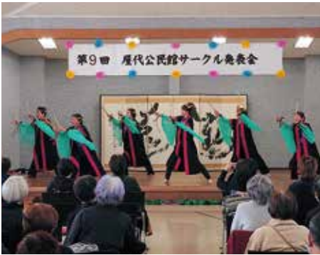
揃いの法被にみなぎる気合！