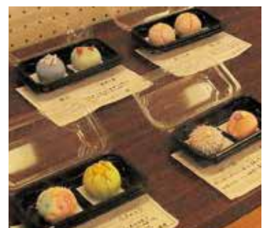
本物そっくりの上生菓子 中学生の力作です