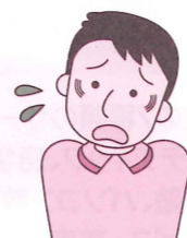
(消費者庁イラスト集より)