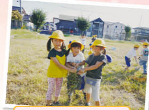
草取りも頑張ります