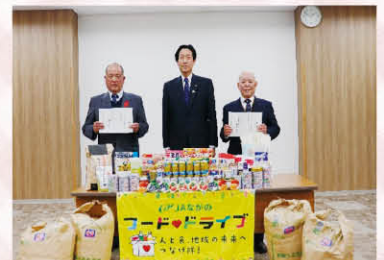
ながの農業協同組合

社協だよりに掲載の講座等につきましては、感染症の発生等不測の事態が発生した場合は、中止または延期する事がありますのでご了承ください。