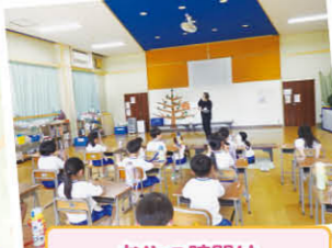
おやつ時間は 職員による読み聞かせ