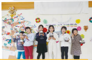
赤い羽根共同募金配分金事業 親子クラフトバンド体験会