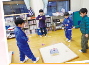
コマ回しなど色々なあそびに チャレンジ中