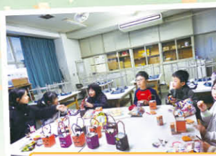
3年生以上は小学校教室 センター分室で過ごします