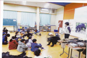
ツキノワグマについてのお話会