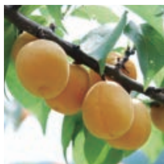
ちょっと珍しいあんずが特産品

長野県に海はありませんが、高速道路を利用すれば1時間ほどで日本海に到着。千曲市は海も山もどっちも楽しめます。