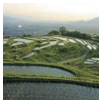
日本遺産の棚田で農業体験