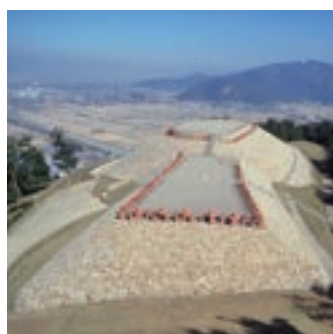
長野県最大規模の前方後円墳