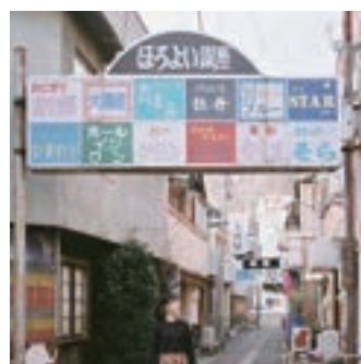
レトロな雰囲気温泉街