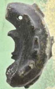
05.「子」だくさんの子持まが玉