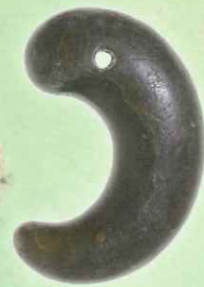
06.峠の神様へのお供え物