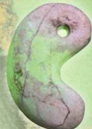
04.光り輝くヒスイ製まが玉