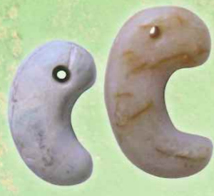
02.東信有力豪族の首飾り