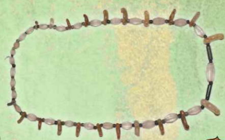
03.王様のネックレス