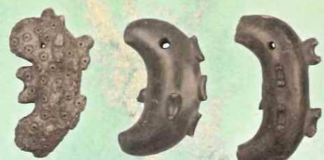
10.横田神社の子持まが玉