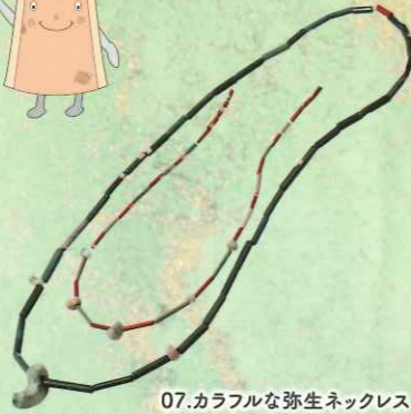
07.カラフルな弥生ネックレス