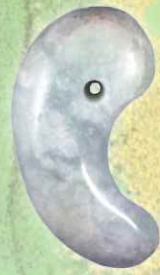
01.国内最大級!! ヒスイ製まが玉