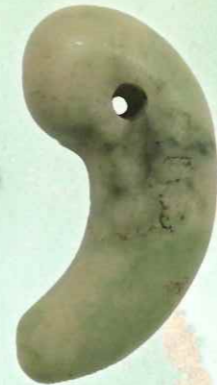
14.北信濃有力者のまが玉