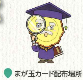
●まが玉カード配布場所