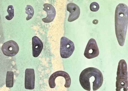
09.縄文時代の玉作り