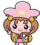
千曲市キャラクター「あん姫」