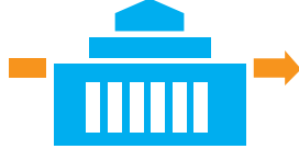
議会同意を経て任命