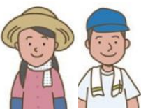
農地利用最適化推進委員

農業委員会が定めた区域ごとに委嘱します。 地域内の「農地利用の最適化の活動」を主に取り組みます。