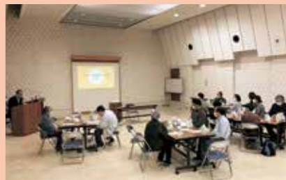
▲第1回目の当事者会の様子

る場があるって良いな」「病気があっても危なくない。偏見をもってはダメ。とても楽しかった」などの感想が寄せられました。