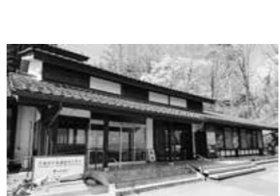
▲日本遺産センター