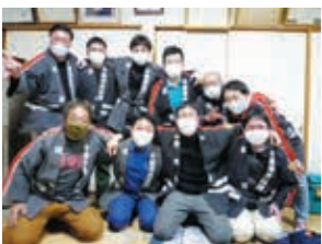
▲新旧幹部の引継ぎ会の様子

団員は20代から40代までの約40人が在籍しており、生まれも育ちも地元という人もいれば、他の地区から転入されて来た人もたくさんいます。そんな集まりなのですが我々第4分団、仲が良いんです。かなり自信を持って言えます。おそらくどの分団にも負けません。ポンプ操作は負けても、そこだけは一番です。