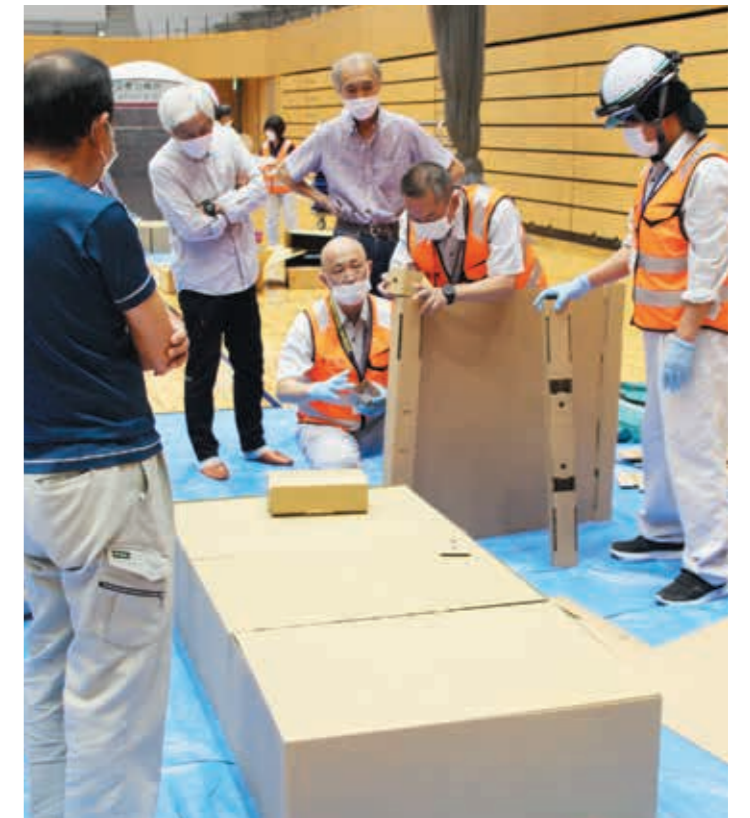
▲昨年実施した新型コロナウイルス感染症を意識した避難所開設訓練