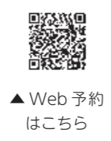
▲ Web 予約はこちら

マイナンバーカード申請者の急激な増加に対応するため、臨時の交付窓口を開設しています。カードの受け取りは、窓口の混雑を避けるため事前にパソコン、スマートフォンや電話での予約をお願いします。予約が困難な場合は、予約せずに窓口で受け取ることもできますが、窓口の混雑状況でお待ちいただくことがあります。