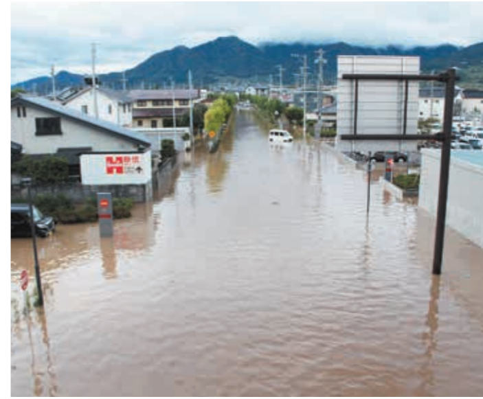
▲令和元年東日本台風災害時の市役所周辺

予約の日時や場所を忘れる、接種券を無くすといった事例が発生しています。予約内容に関する問い合わせへの回答は時間がかかります。予約や接種券などの管理は、家族の人もご協力をお願いします。