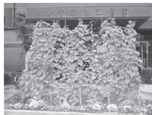
▶昨年の夏、千曲商工会議所に設置されたグリーンカーテン

自宅、職場や学校などの窓辺で、つる性植物をカーテンのように育て、日光を遮ったり和らげることで室温の上昇を抑えられます。また、植物の間を通り抜ける風が冷やされることで室内を快適にすることもできます。節電・省エネの効果があり、花の鑑賞や実の収穫も楽しめます。グリーンカーテンで暑い夏を快適に乗り切りましょう。