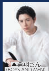
▲勇翔さん (BOYS AND MEN)