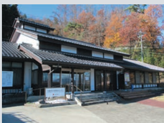
▲千曲市日本遺産センター

古くから善光寺参りの精進落としての湯として栄えてきた戸倉上山田温泉は、開湯120年を経て信州屈指の温泉街を形成し、周囲には「さらしなの里」「名月の里」「あんずの里」の観光地が形成されています。令和2(2020)年には、姨捨の棚田をはじめとした「月見」の物語が日本遺産に認定され、さらなる観光需要が見込まれています。