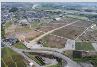
▲開発中の八幡東産業団地

首都圏と北陸圏を結ぶ高速道路のジャンクションという立地を活かし、最先端のハイテク産業、精密加工業、食品産業が育っています。