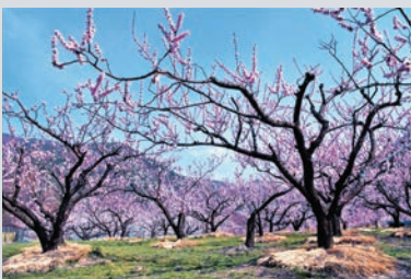
▲満開のあんずの花

千曲川の豊かな水によって育まれた肥沃な大地に恵まれ、「日本一」といわれるトルコギキョウを中心とした花卉栽培、リンゴやブドウなど多品目の果樹栽培が盛んです。また、観光とのタイアップによる姨捨の棚田のオーナー制度、「一目十万本」といわれる「日本一のあんずの里」など魅力ある農業を進めています。