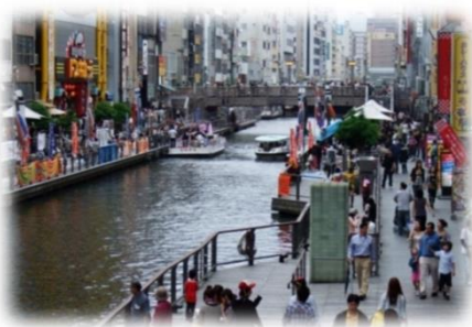
遊歩道の民間活用 (道頓堀川／大阪市)