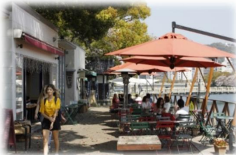
オープンカフェの設置 (京橋川／広島市)