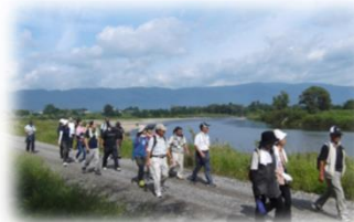
河川管理用通路の利用 (最上川／長井市)