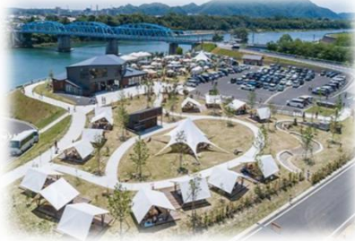
賑わい拠点の整備 (木曽川／美濃加茂市)