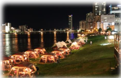
民間事業者の参加 (信濃川／新潟市)