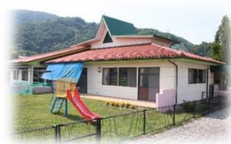
心身障害児母子通園訓練施設「あすなろ園」