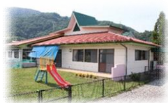
心身障害児母子通園訓練施設「あすなろ園」